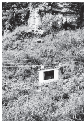
【図5】大崖の前の山神廟と童顔の山神(土地) 湘西州鳳凰県の山江村への道沿いにて(1998年8月24日)