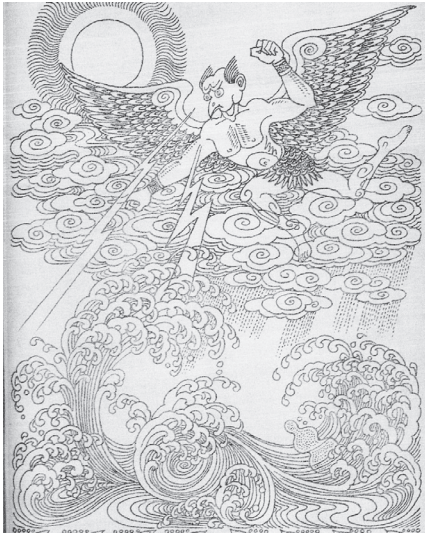
【図3】大地を水底に沈ませる〈オンドリ雷神〉 （挿絵『苗族史詩』洪水の章）