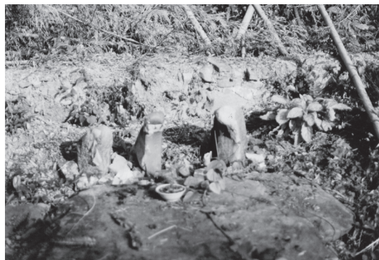
【 図2 】 三つ石の山神（社王） 金秀瑶族自治县六巷郷の上古鎮への道沿いにて （1991年11月21日）

なお、山神はその土地によって大樹（龍樹、神樹等）やうっそうと茂る森、洞、崖等であったり、「石から生まれた」という神話伝承群が語る通り石であったり。大岩、卵石、直立した石、男性器に似た石、乳房に似た石、三つ石【 図2 】、まか不思議な形の石、それに彩色した塑像等多様である。その在所は見聞によれば山頂