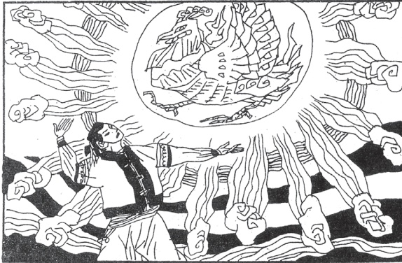
〔図1〕太陽の〈オンドリ雷神〉 連環画「高辛と龍王」(倉族) 〔中国神話故事大全〕1990 浙江少年儿童出版社〕

それを豊作にした豊穰神（穀物神）であり、弱者を扶け悪者をくじく善神であり避邪禳災と疫病駆除の至高神である。そしてなによりも人類の祖を授けた祖先神であり始祖神であった。